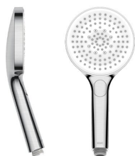
CHOICE-G Doccia manuale