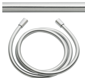
SHOWERCULTURE Tubo flessibile per doccia

Rubinerie per doccia | Rubinerie monocomando per doccia