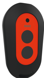
Telecomando con 2 funzioni