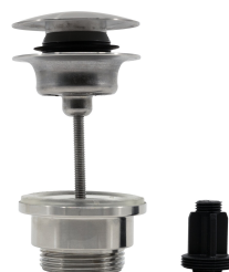
Válvula de vaciado Push Open