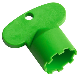
Service key Neoperl © Caché ©, TJ, 18 mm, green