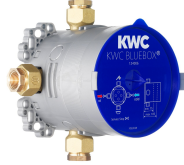
BLUEBOX Unità sotto muro