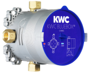
BLUEBOX Unità sotto muro

Valvole | Valvola termostatica del miscelatore